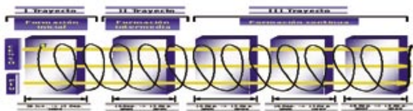
Gráfico Número 1. Expresa la estructura Sistémica y temporal del Programa Nacional de Formación de Educadores.

El Programa de Formación de Educadores del cual formo parte que es Licenciatura está estructurado en tres trayectos fundamentales, uno de Formación Inicial, otro de Formación Intermedia y otro de Formación Continua como se observa en el Gráfico Número 1